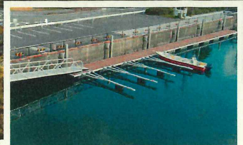
■港湾名 水俣港 ■場所 熊本県水俣市汐見町地内 ■施設 桟橋(延長:43m) 駐車場有 ※係留は有料