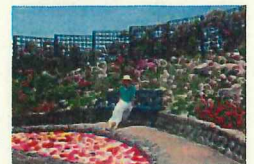
② エコパーク水俣 バラ園 広大なエコパーク水俣の入り口に位置する13,000㎡のバラ園では、バラの香りや美しさをじっくり楽しめます。