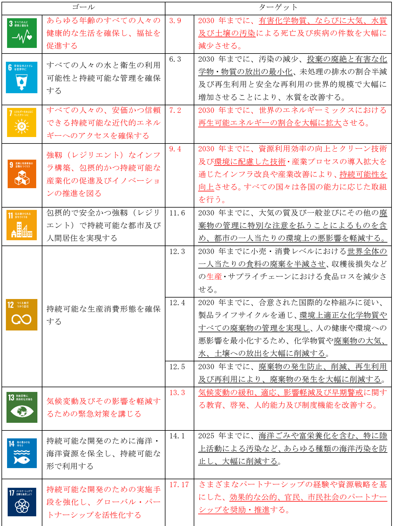
表 1-1-1 本計画が対象とする SDGs のゴールとターゲット