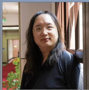
オードリー・タン「唐鳳」氏

アメリカのApple社顧問に就任するが、33歳でビジネスの世界からリタイアを宣言する。35歳の時、史上最年少の若さで蔡英文政権にIT大臣として入閣し、IQは180超とも言われている。