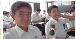
大学訪問 (ナノサイエンス講座)