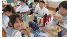
昼休みに高校生と交流