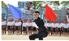
生徒主体の体育祭