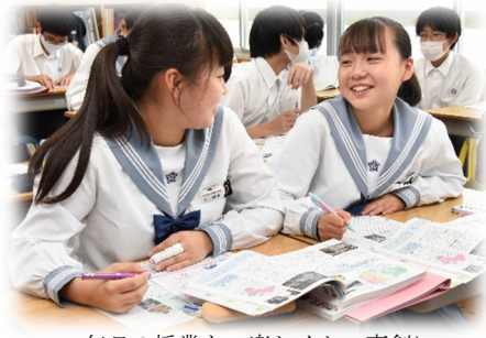
毎日の授業も、楽しくかつ真剣に

世界に羽ばたくリーダーの育成を目指し、心を育て、全国難関大学等への進学を実現する。 夢実現・未来への挑戦～ENTERPRISE～