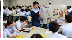
英語合宿で留学生と交流