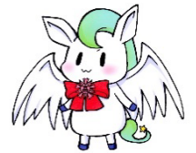
本校キャラクター わかごまる