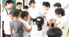
生徒主体の文化祭