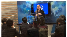
修学旅行で英会話体験