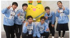
科学の甲子園 Jr 全国大会