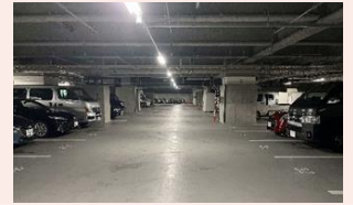
八代市役所本庁舎地下駐車場