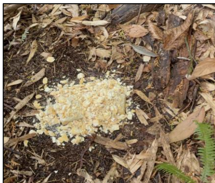
図2 散布箇所の様子 (※ワクチンの上に誘引の餌をかぶせています。)