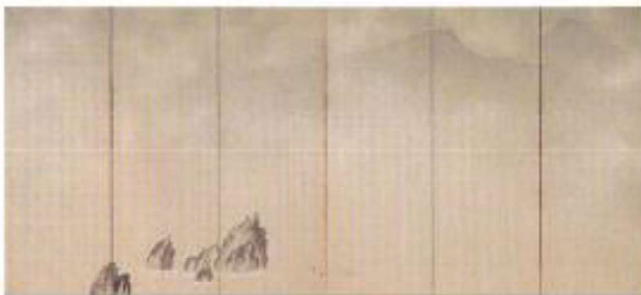
横山大観《霜月頃》大正6年(1917) 熊本県立美術館蔵

ミュージアム ● 日時:5月30日(土) 14時00分~15時00分 セミナー ● 講師:学芸員 金子清史 ● 会場:文化交流室