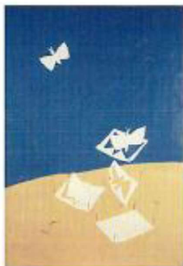
大塚耕二《出雲》昭和11年(1936) 熊本県立美術館蔵