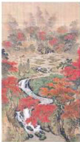
杉谷雪樵《新田川水滸和明治時代》(19世紀) 熊本県立美術館蔵