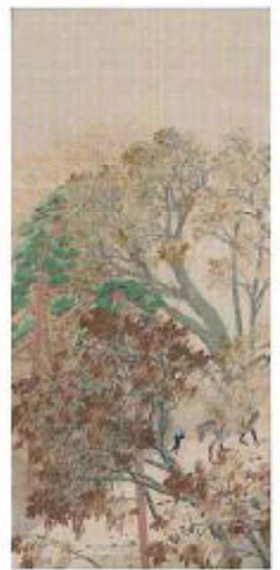
横山大観《山雨》明治44年(1911) 熊本県立美術館蔵

ミュージアム ● 日時:5月30日(土) 14時00分~15時00分 セミナー ● 講師:学芸員 金子清史 ● 会場:文化交流室