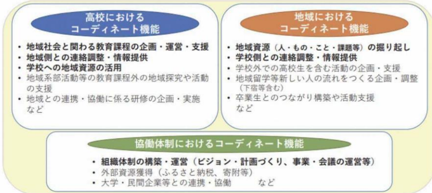
図5：高校と地域をつなぐコーディネート機能の位置づけ