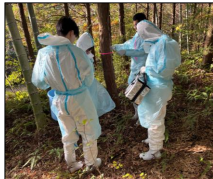
図3 散布作業の様子