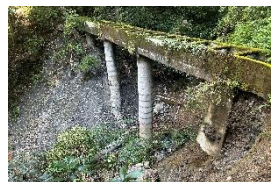
⑤東部幹線用水（美里町）