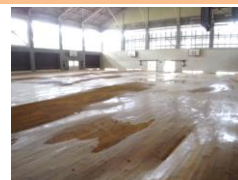
⑦小川工業高校体育館