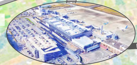
阿蘇くまもと空港