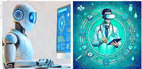
ロボット 遠隔医療