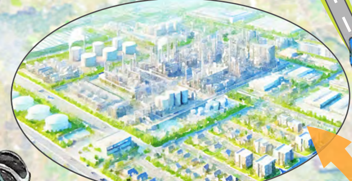
県営工業団地(菊池市事業区)