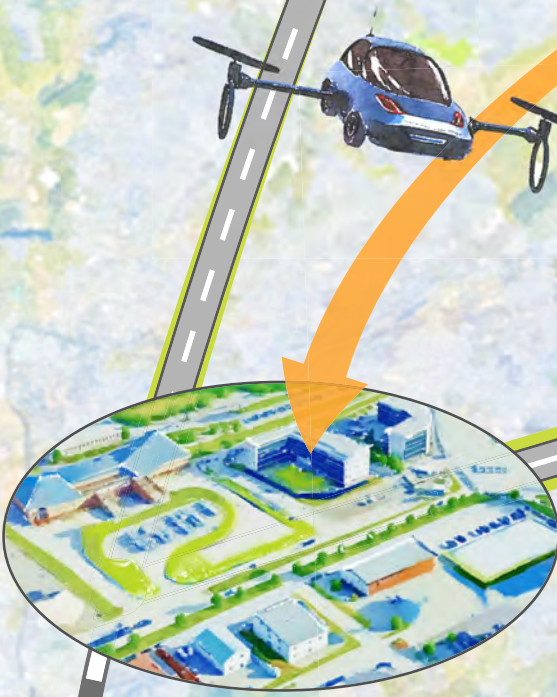
御代志地区土地区画整理事業