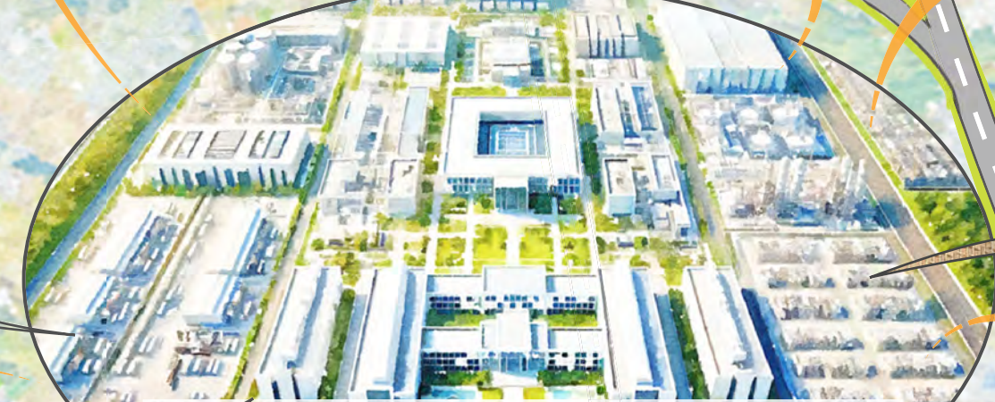
セミコンテックパーク近隣 + 新たな産官学連携拠点「イノベーション創発エリア」