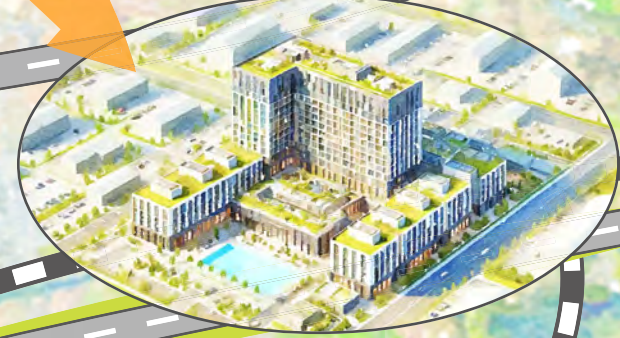
肥後大津駅・ 空港アクセス鉄道中間駅周辺