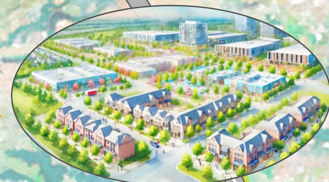
旭志地区・宅地/商業地の開発