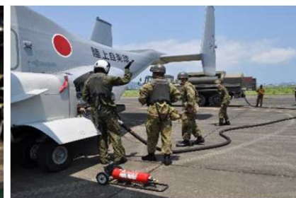
航空機への燃料補給・整備