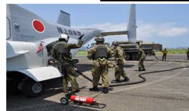
共同兵站訓練（燃料補給・整備）