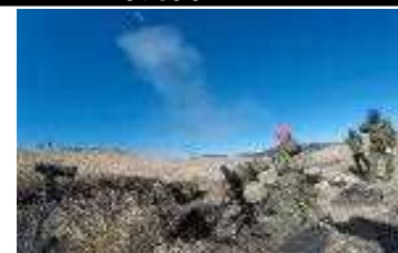
共同戦闘射撃訓練