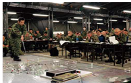
机上訓練（指揮機関訓練）