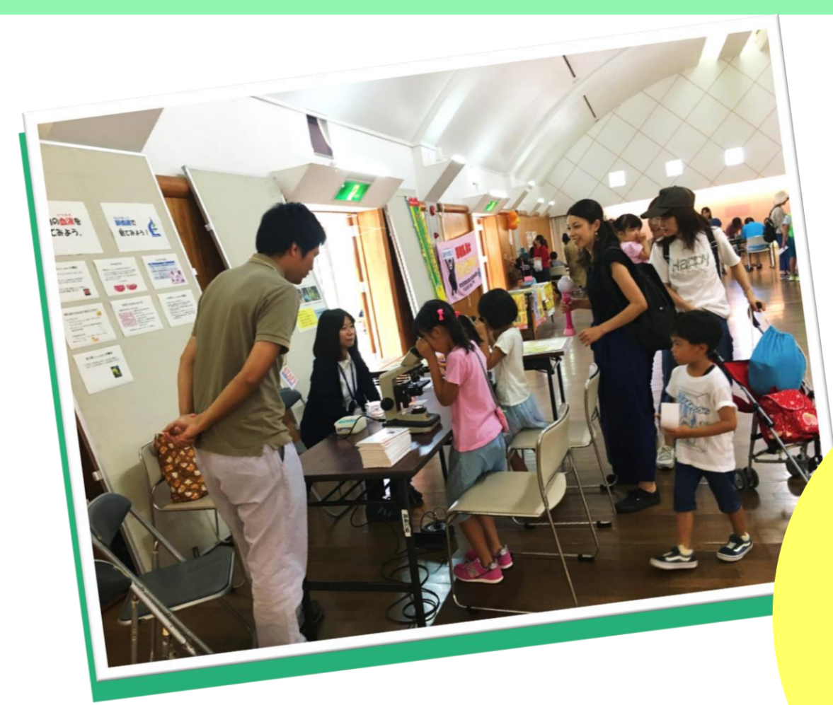
イベントでの 展示紹介