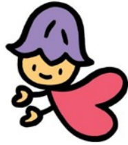
熊本県人権啓発キャラクター「ココロ」

日時 令和5年12月3日（日） 午後2時～午後4時10分（午後1時30分開場） 会場 ホテル熊本テルサ テルサホール （熊本市中央区水前寺公園28-51）