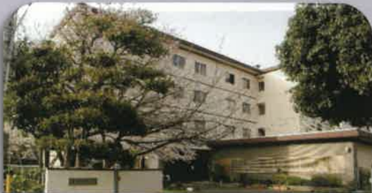
埼玉県志木市にある学生寮「有斐学舎」