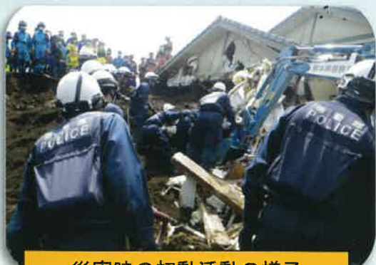
災害時の初動活動の様子