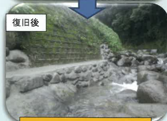
熊本県菊池市四町分の河原川