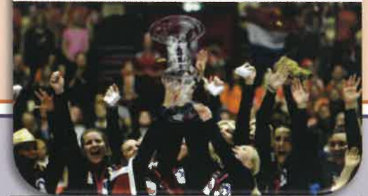
2019女子ハンドボール世界選手権大会リーフレットより