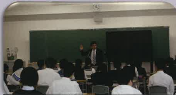
時習館海外チャレンジ塾 開校式の様子