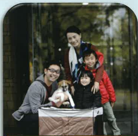
県庁プロムナード譲渡会の様子 「新しい家族との出会い」