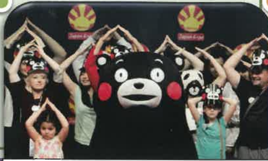
くまモン隊の海外イベントの様子