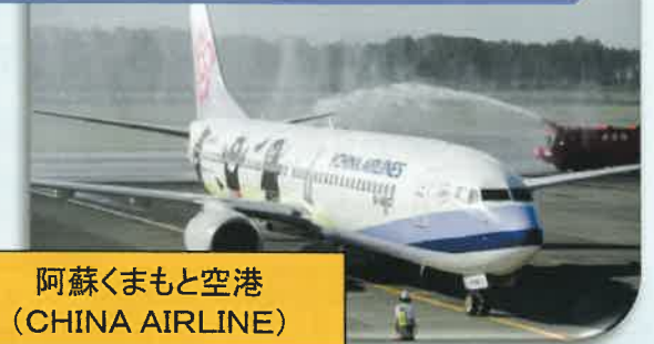
阿蘇くまもと空港 (CHINA AIRLINE)

コンセッション方式の導入(空港運営の民間委託)による国内線・国際線ターミナルビルの一體的整備・耐震化を図り、空港及び周辺地域の活性化を促進