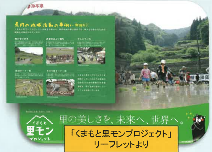
「くまもと里モンプロジェクト」 リーフレットより