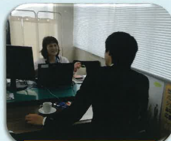
就労支援・カウンセリングの様子