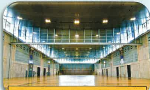
熊本県上益城郡益城町にある 産業展示場(グランメッセ熊本)

震災の風評被害により減少した交流人口を回復・拡大させるための、市町村や地域の方々の自主的な地域づくりの取組みや、市町村域及び県境を越えて連携した取組みを支援