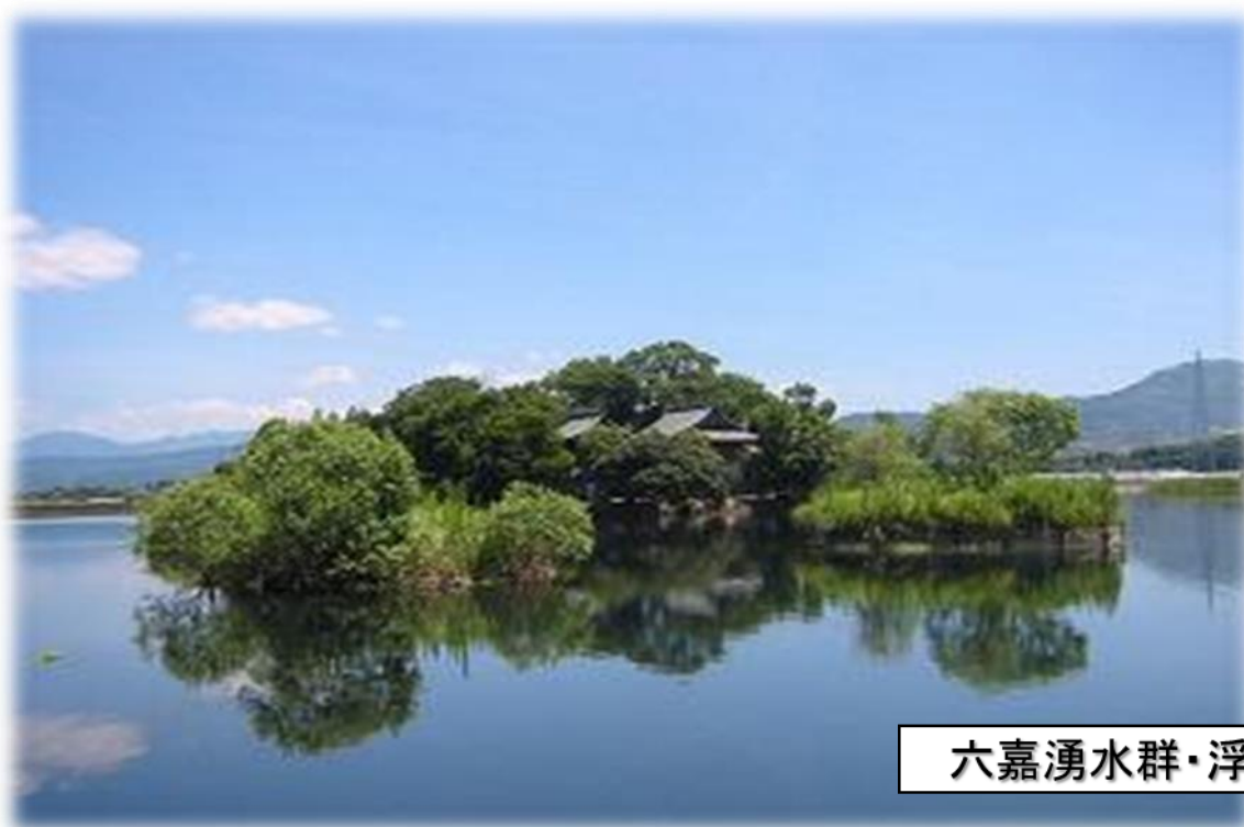
六嘉湧水群・浮島