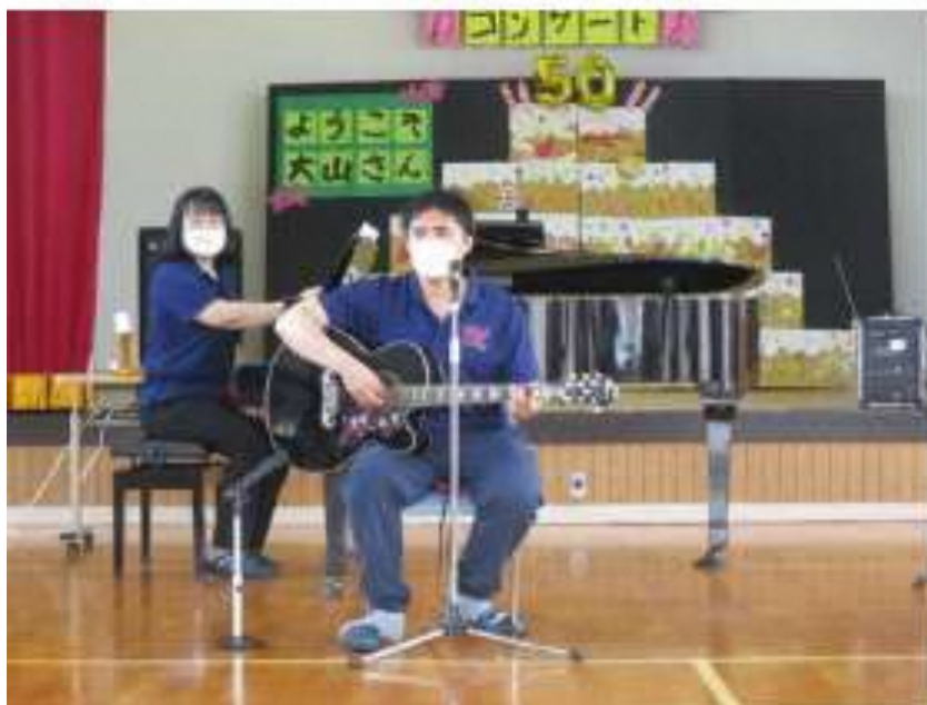
※本校でのコンサート の様子