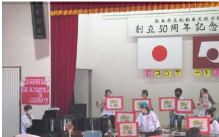
※本校でのコンサート の様子

※かあちゃんずさんは、割烹着がトレードマークの宇城市のボランティアグループ（管楽器アンサンブル）の皆様で、年に数回、本校の子ども達と一緒に音楽活動をしていただいたり、素敵な音楽を聴かせていただいたりしています。