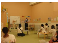
←「子どもプラザわくわく」での様子