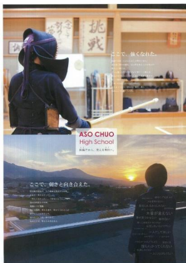
ポスター部門最優秀賞 (阿蘇中央高校)