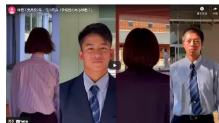
動画部門最優秀賞 (球磨工業高校)