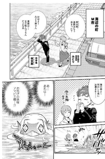
マンガ部門最優秀賞 (八代農業高校泉分校)