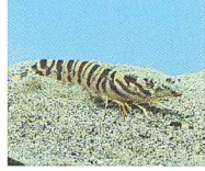
県の魚：くるまえば Prawn

統計は、私たちが暮らしの現状を知り将来を予測するうえで重要な役割を果たしています。