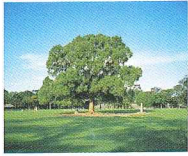
県の木：くす Comphor tree

The symbol of Kumamoto is stylized in the shape of katakana ク of クマト(KUMAMOTO),and the geographical contour of the island of Kyushu.The circle in the middle of the design symbolizes the location of Kumamoto Prefecture and its strong and powerful central position.