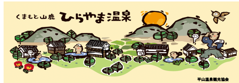
平山温泉観光協会