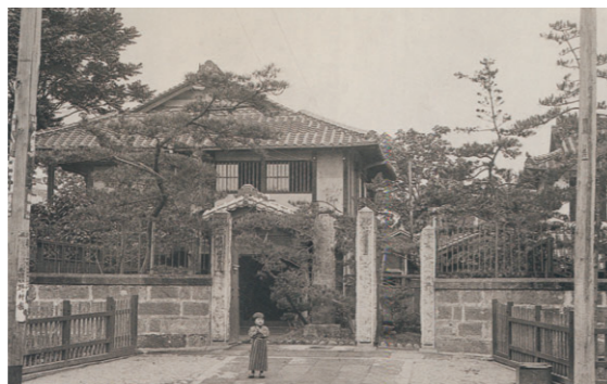
▲開設当時の福田病院(熊本市)

This work was so hard and he was very tired. It was difficult to collect donations