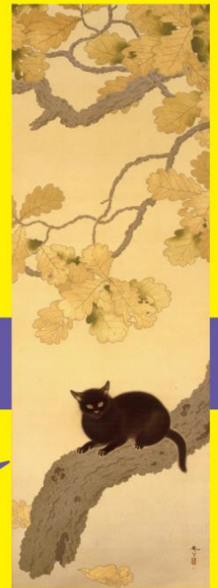
重要文化財 菱田春草《黒き猫》明治43年(1910) 公益財団法人永青文庫蔵(当館寄託) ※展示期間:7月22日(水)~8月16日(日)