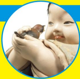
平田郷隔(子雀) 昭和時代 当館蔵 ※展示期間:7月11日(土)~8月16日(日)