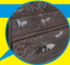
《紫檀山桜に蝶図煙草盆》江戸時代 公益財団法人永青文庫蔵 ※展示期間:7月11日(土)~10月4日(日)