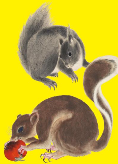
《珍禽奇獸図》部分 江戸時代中期(18世紀) 公益財団法人永青文庫蔵

今回は動物の剥製(はくせい)(熊本県博物館ネットワークセンター所蔵)を特別展示し、作品と実際の比較を楽しむこともできます。あまりに緻密な描写に息をのむこともあれば、キャラクター化した愛らしい姿にギャップを感じることもあるでしょう。この夏はぜひ、「二の丸動物園」でたくさんの動物との出会いをお楽しみ下さい。