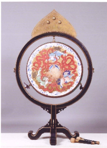
《時習館太鼓》文政10年（1827） 永青文庫蔵（通期展示）