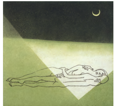
《月夜》1977年 エッチング、アクアチント