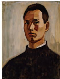
《自画像》1939年 油彩 東京藝術大学蔵