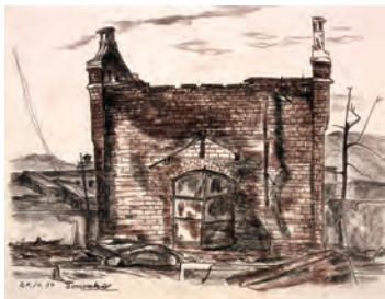
《焼け跡のスケッチ(熊本にて10.30)》 1945年 コンテ