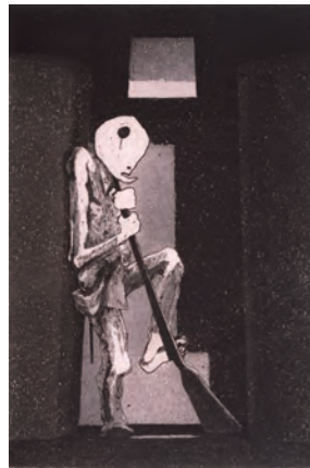
《初年兵哀歌(歩哨)》 1954年 エッチング、アクアチント

今年第二次世界大戦が終わって70年になります。わが国の戦後美術史に欠かせない存在である浜田知明は、1917年熊本県上益城郡高木村(現・御船町高木)に生まれました。旧制御船中4年修了の16歳で東京美術学校油画科に入学。美術学校卒業の年に入隊した浜田は、中国大陸での戦争体験を1950年代に銅版画として発表、それらの小さな画面は「初年兵哀歌」シリーズと呼ばれ、わが国の美術界に強い衝撃と大きい感動を与えました。40歳になる年の1957年から熊本市に住み、世界の動きと人間を見つめながら、作品を作り続けてきました。1983年からは彫刻の制作も始め、97歳になる現在も創作意欲は衰えず、その作品世界が一貫して持つ人間への深いまなざしは、ヨーロッパやアメリカでも高く評価されて来ています。浜田知明の作品は、いずれもがゆるぎない造形性に裏付けられ、普遍的でしかもオリジナリティにあふれた表現によって、20世紀後半から21世紀にわたる時代の優れた美術家として永く歴史に残る作家に位置づけられることでしょう。今回の「浜田知明のすべて」では、旧制御船中時代から、97歳の新作彫刻《腐っていく兵士》や《会者定離》まで、文字通り浜田知明の世界の全貌を紹介いたします。当館開館の1年前に民間で設立された、熊本県立美術館友の会の設立40周年記念事業として開催いたします。