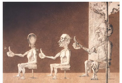
《ボタン(B)》1988年 エッチング、アクアチント