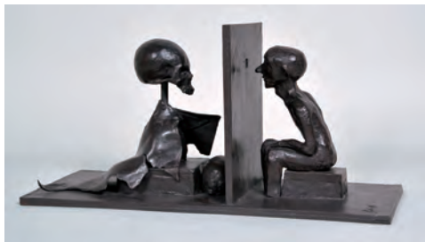
《幽界を覗く人》2010年 ブロンズ