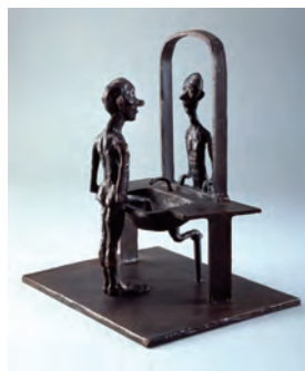
《鏡》1993年 ブロンズ