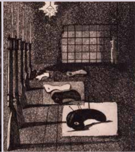
《初年兵哀歌(銃架のかけ)》1951年