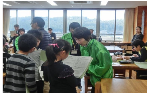
理科の授業でのボランティアの様子

年度末に一年間お世話になったボランティアの方に集まっていただき、「ボランティアの集い」を開催している。学年ごとに、ボランティアの方への御礼の手紙渡しや合唱等の発表等を通して、地域との交流を深めている。