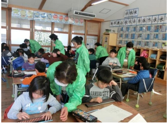
そろばん授業の指導・支援