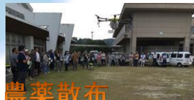
ドローンによる農薬散布