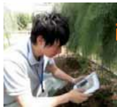
iPadを活用した普及活動