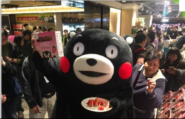
小売店での県産農産物PR（香港）