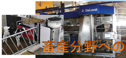
畜産分野へのロボット類導入