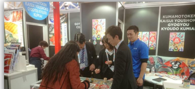
「シーフード・エキスポ・ノースアメリカ2019」 での県産水産物のPR（アメリカ）