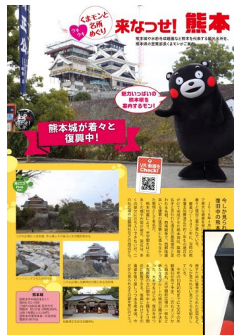
・KADOKAWA/ アルファコード 「くまモンVRWalkerの制作」