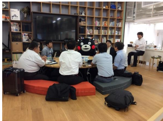
【くまラボでの検討の様子】