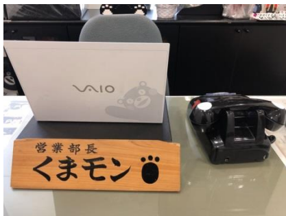
・VAIO 「くまモン」刻印パソコン