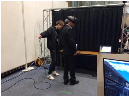
・東大先端研 「VRくまモンの制作」