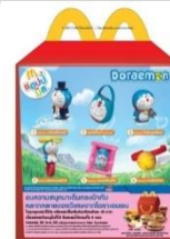
ノベルティイメージ