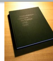
ガイドブックイメージ