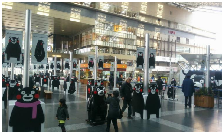
JR大阪駅「時空の広場」でのイベントの様様