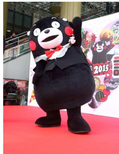
去年の誕生祭の様様