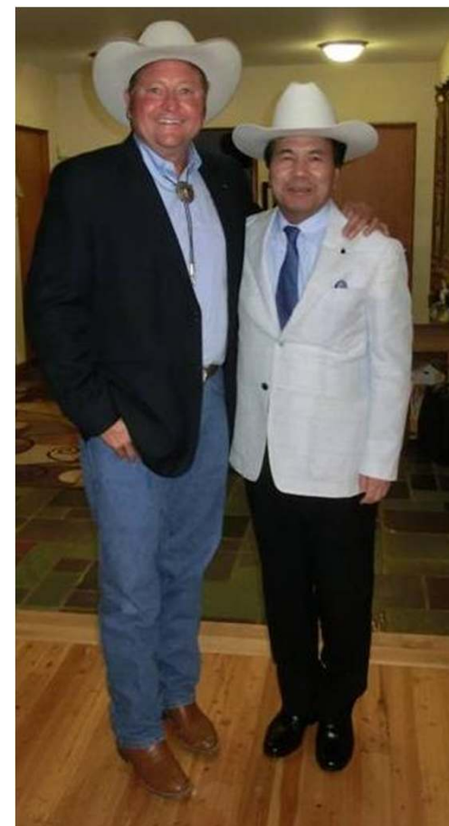
シュワイザー州知事 と蒲島知事