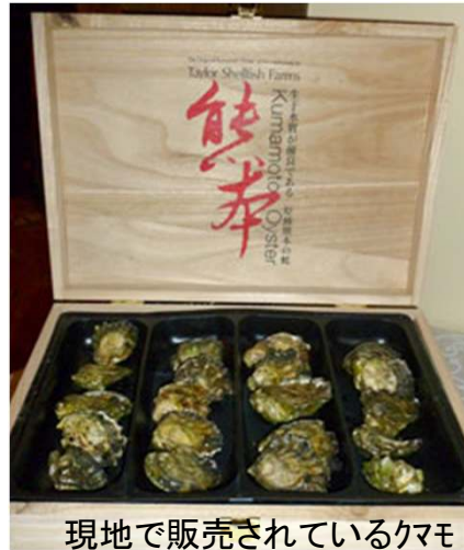
現地で販売されているクマモトオイスターも試食された。