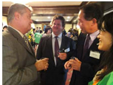
日米関係者の歓談の様子