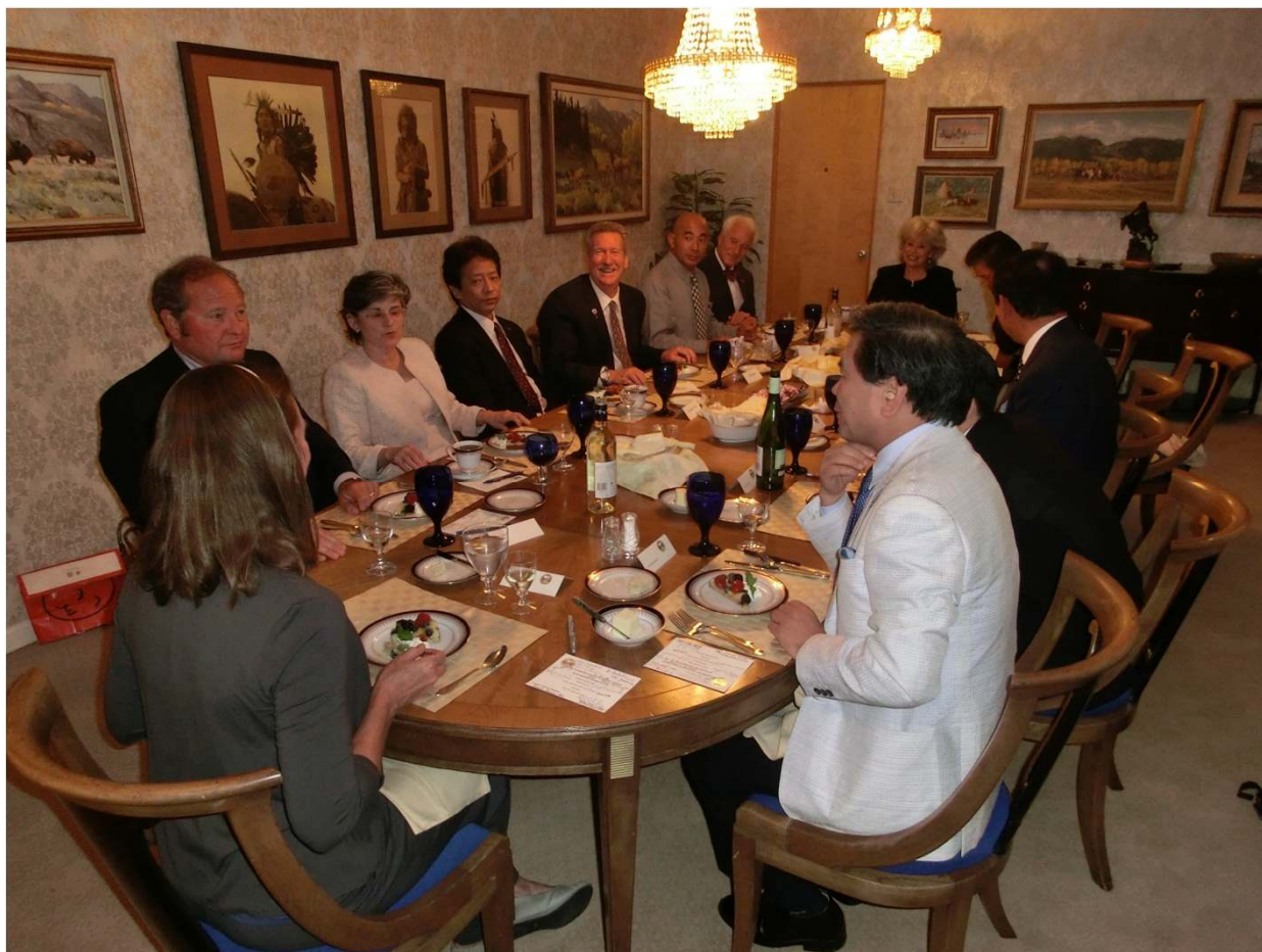
シュワイザー州知事ご夫妻主催夕食会