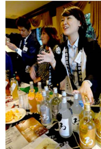
県内焼酎メーカー5社がPRを行った。