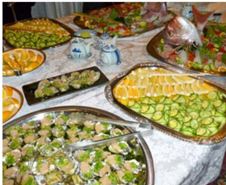
ハマチ、タイ等シーフードを中心としたメニューが並んだ。