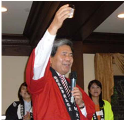
乾杯の音頭を取る蒲島知事