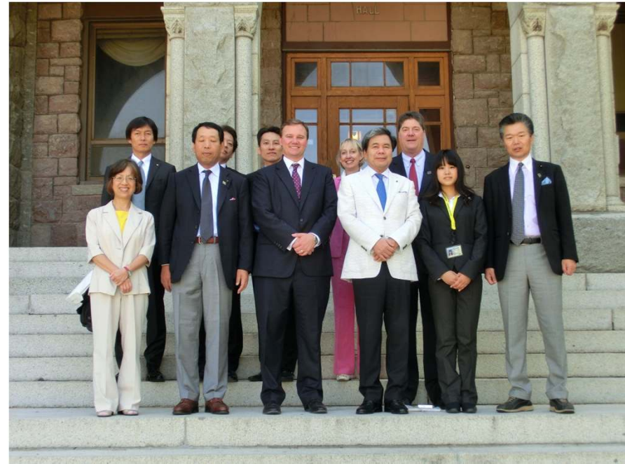
キャロル大学にて