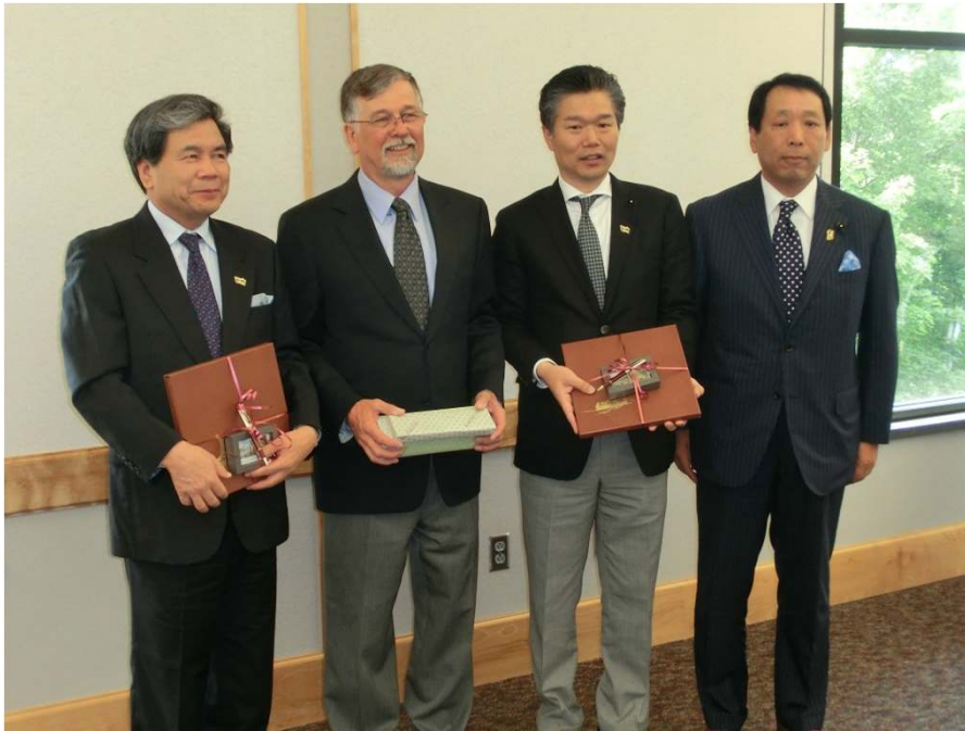
州立モンタナ大学にて