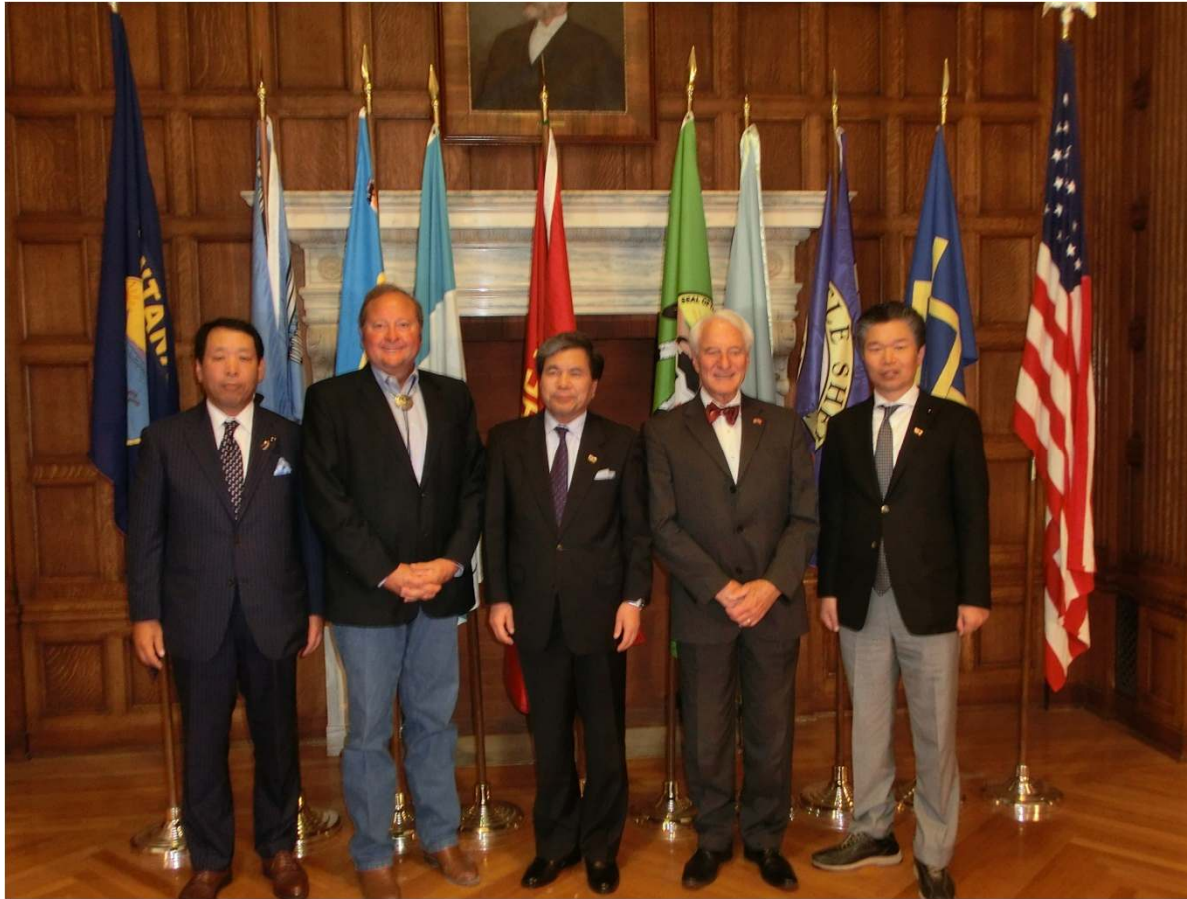
(左から)藤川議員、シュワイザー州知事、蒲島知事、ボリンジャー副知事、馬場議長