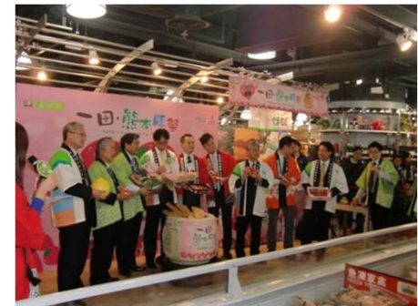
H23.2月香港トップセールス