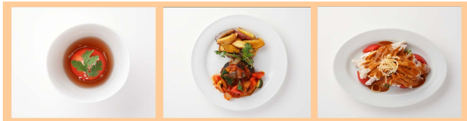
塩トマトの山楂酒漬け