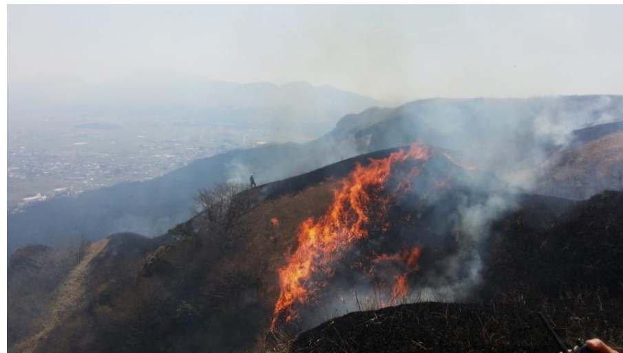
H26.4 西湯浦野焼き再開を半世紀ぶりに実現