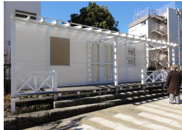
漱石山房記念館(仮称)