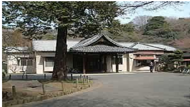
松聲閣 (しょうせいかく) H28年1月復元