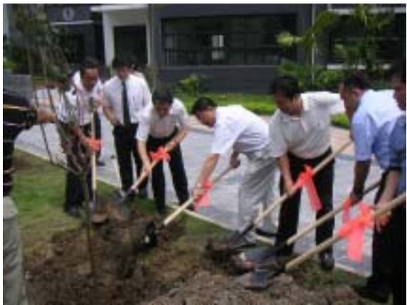
南寧日本園における植樹式