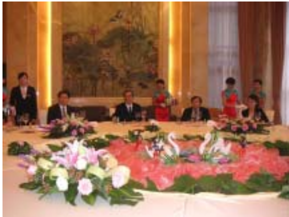
広西壮族自治区政府主催歓迎会