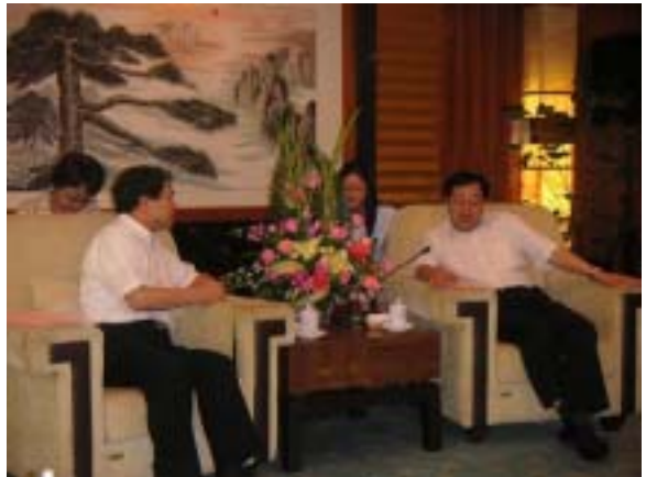
南寧市黄市長表敬