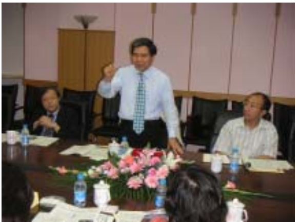
復旦大学における知事講演