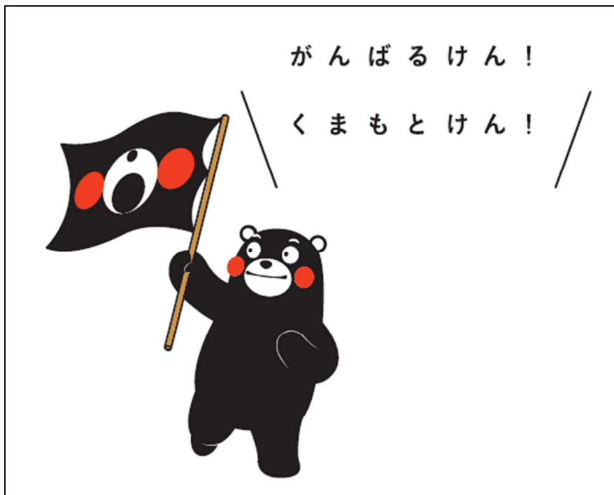
(左) シンボルマーク (下) 旗印「くま紋」