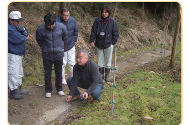
電圧のチェックはおこたらずに