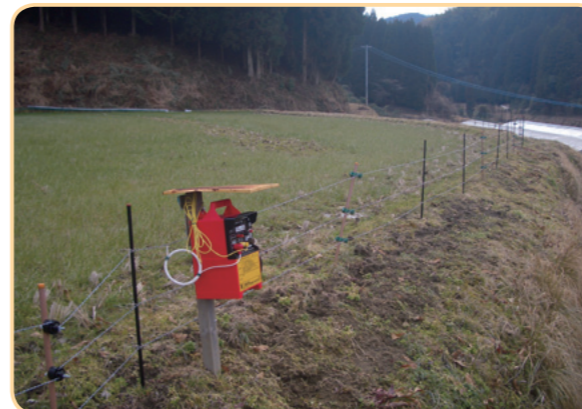
電気柵の設置例。ガイシの向きは外側に柵の周りの除草も大切