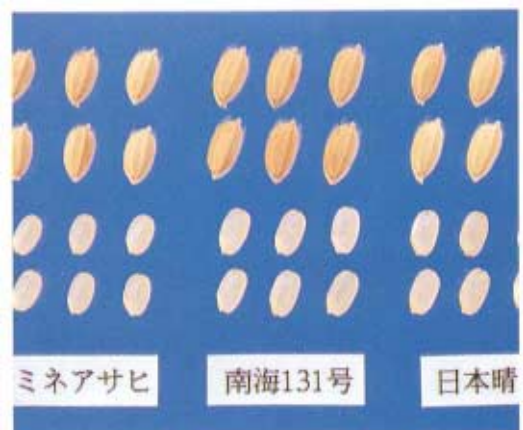
写真2 籾・玄米標本