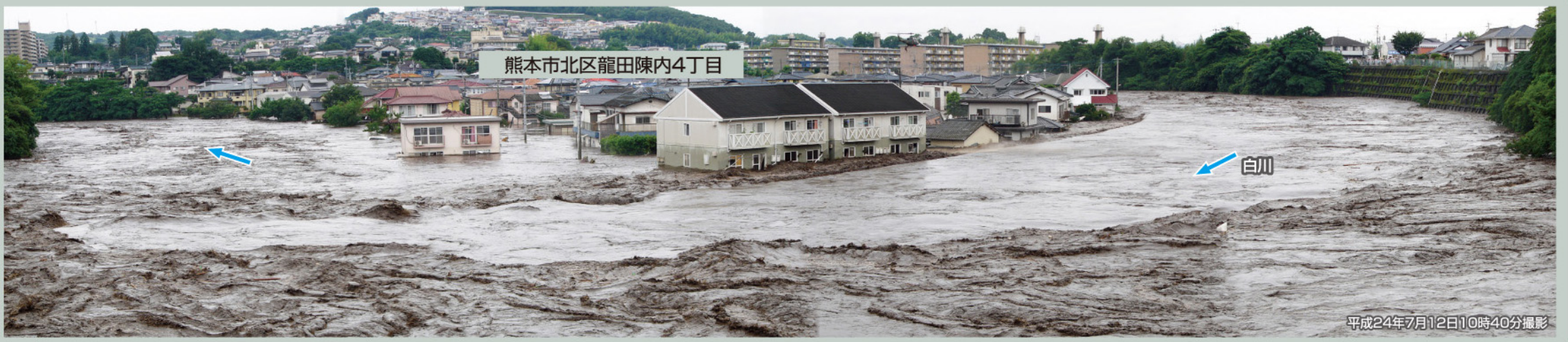
熊本市北区龍田内4丁目