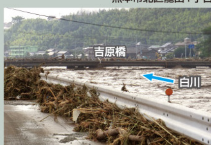
熊本市北区龍田町弓削