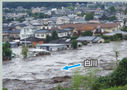
熊本市北区龍田1丁目