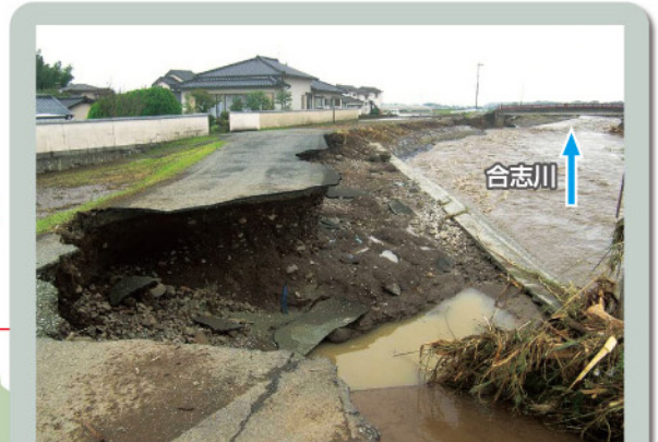
菊池市泗水町住吉