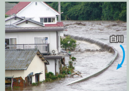
熊本市北区龍田内4丁目