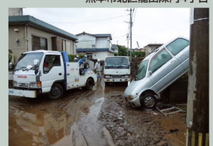
熊本市北区龍田内4丁目