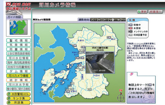
統合型防災情報システムの画面イメージ