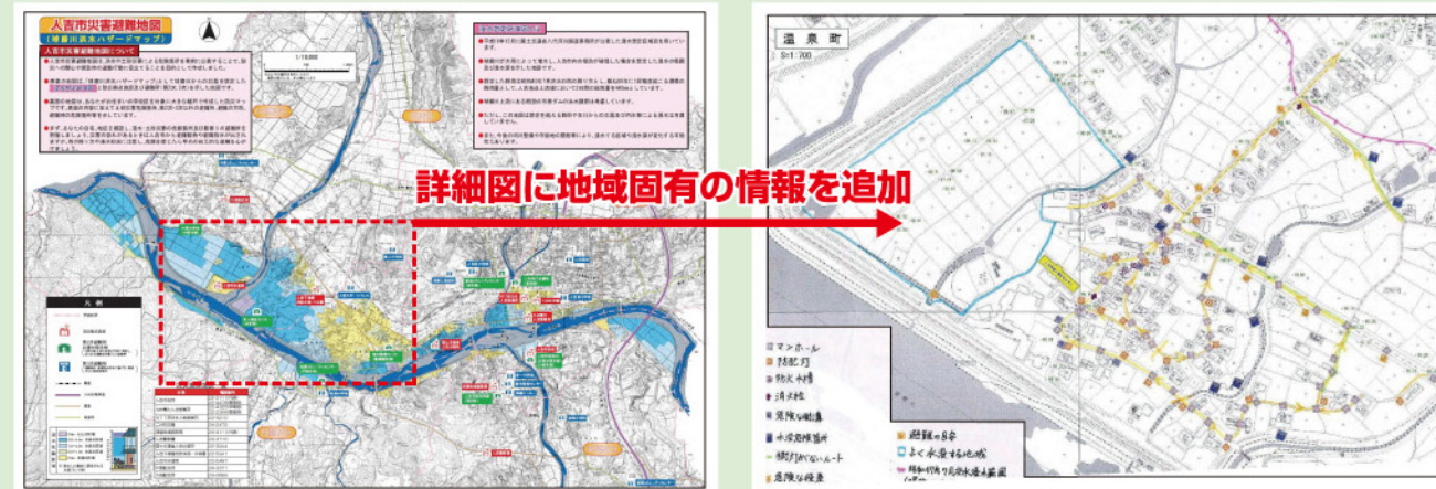
ハザードマップ作成例

県では、洪水の浸水想定区域図を作成し、市町村のハザードマップ作成を支援しております。一部地域ではマイハザードマップの作成を支援しております。