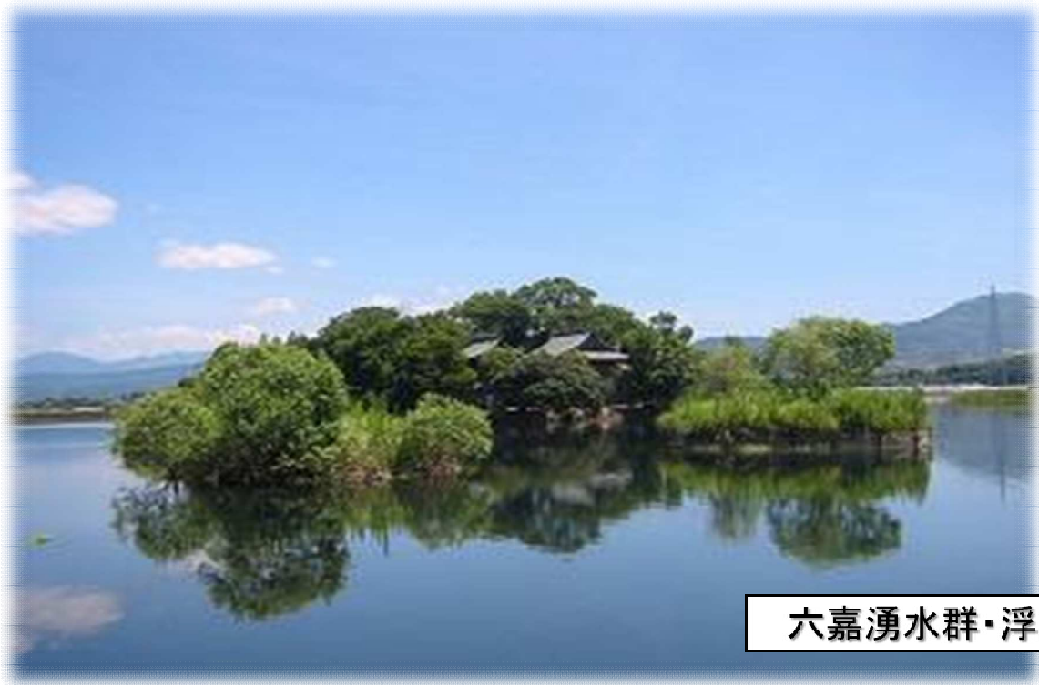
六嘉湧水群・浮島