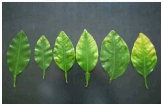
写真1 被害葉の形態(最左は健全葉)