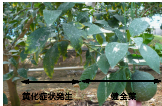
写真2 灌漑水代替後の樹の生育