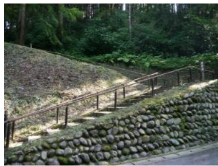
駐車場から滝へおりの道