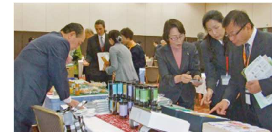
〔香港バイヤー招へい商談会〕