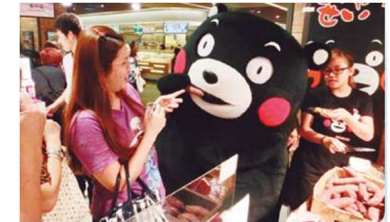
〔アジアでの物産展〕

海外誘客に向けて、多様なニーズを踏まえた旅行商品の造成や販売促進、ハード・ソフト両面での受入環境の整備を進める。さらに、誘致を進める国際航空路線の中でも、特に台湾線は機材繰りの調整という最終段階にあるため、航空会社等との協議を継続し、定期便の開設を実現する。