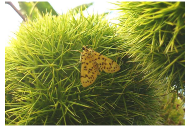
写真1 モモノゴマダラノメイガ(成虫)