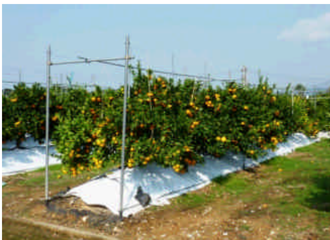
写真1 「肥のあけぼの」の根域制限栽培