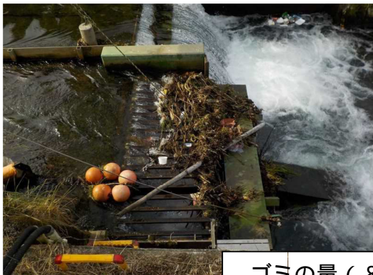
ゴミの量 (8日分 (12/28 調査))