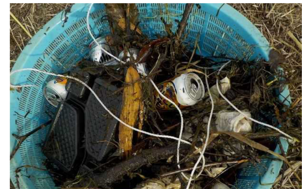
ゴミの種類 (草木、缶、弁当トレー等 (12/28 調査))