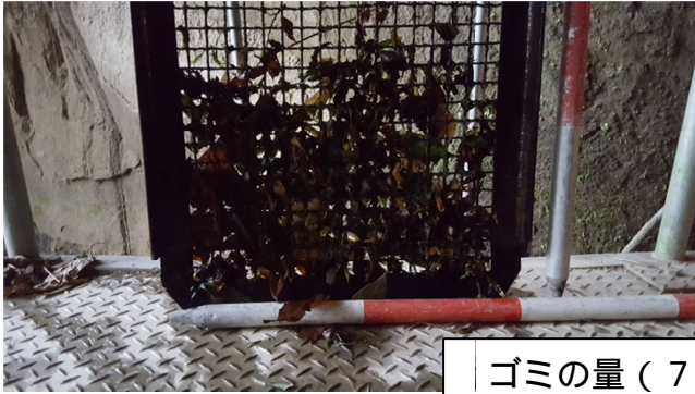
ゴミの量 (7日分 (1/9 調査))