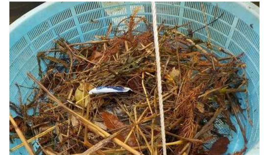
ゴミの種類 (草木、菓子袋等 (1/18 調査))