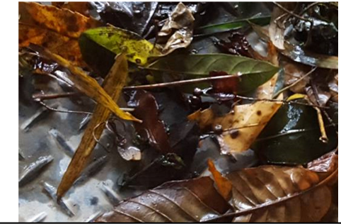
ゴミの種類 (落ち葉等 (12/29 調査))