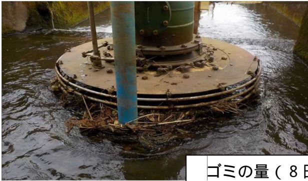
ゴミの量 (8日分 (12/28 調査))