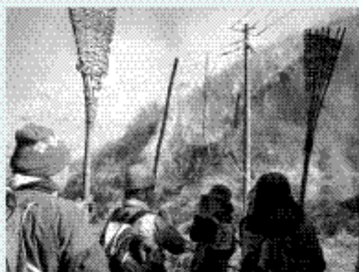
【野焼き支援ボランティア初心者講習会での野焼き体験】

また、阿蘇グリーンストックでは、水源涵養のため、阿蘇郡内の森の除草刈りなど、森づくりのボランティアも行っています。