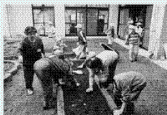
【高齢者と子どもと一緒に花植え】

のぎくまつりでは100人以上の子どもたちがボランティアとして参加し、多くのアトラクション等を実施し、村民の楽しみのひとつとなっています。