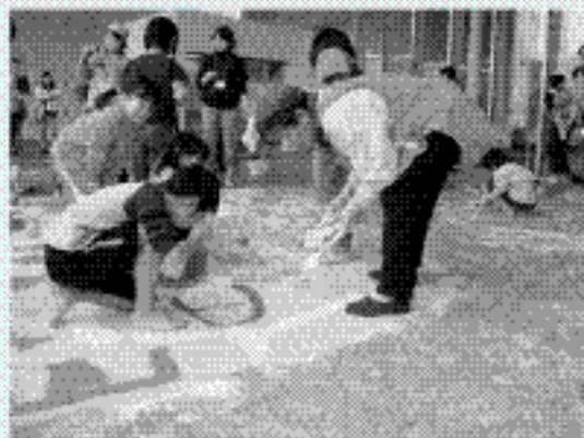
【みんなでお絵かき】 (西合志町社協デイサービス)

「デイサービスを複合させて、同世代はもちろん、世代の違う者同士がふれあうことで、お互いに支え合わなければならないという意識が芽生えていると思います。」