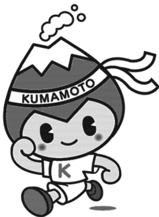
健やか生活習慣くまもと県民運動